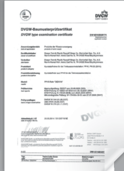
DVGW QUALITY CERTIFICATE (GERMANY) DVGW KALİTE SERTİFİKASI (ALMANYA) DVGW СЕРТИФИКАТ (ГЕРМАНИЯ)