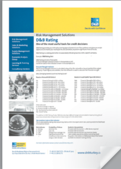
JCR RATING CERTIFICATE JCR DERECLENDİRME BELGESİ JCR РЕЙТИНГ