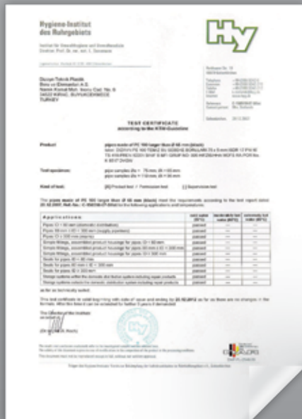
HYGIENE CERTIFICATE (GERMANY) HÜYEN SERTİFİKASI (ALMANYA) СЕРТИФИКАТ ГИГИЕНЫ (ГЕРМАНИЯ)